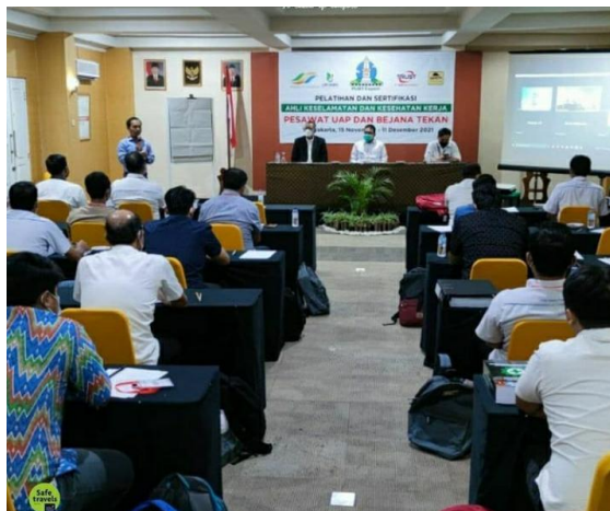
Gambar 4.2 Pelayanan banquet

Menurut Bapak Aji selaku supervisor banquet Peranan Banquet Event Order untuk meningkatkan kualitas pelayanan banquet di LPP Convention Hotel Yogyakarta adalah sebagai berikut :